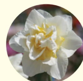
Narcissus double 'White Lion'