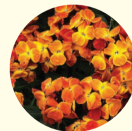
Cheiranthus cheirii 'Sugar Rush'