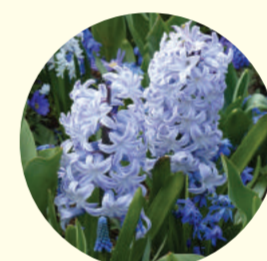
Hyacinthus orientalis 'Blue Eyes'