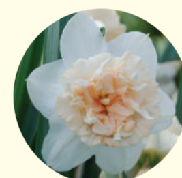
Narcissus double 'Petit Four'