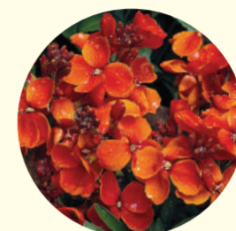
Cheiranthus cheirii 'Scarlet Emperor'

Les jardiniers ont souhaité traduire la virtuosité du peintre à transcrire avec précision et finesse les nombreux symboles des arts qui l'entourent. Ils ont imaginé un massif aux couleurs chaudes, rehaussé de blanc, en utilisant des giroflées rouge orangé, des fritillaires jaunes, des narcisses bicolores et des tulipes ocre, jaunes et blanches.