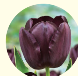
Tulipe triomphe 'Black Beauty'