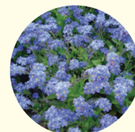
Myosotis sylvatica 'Miro'