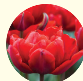
Tulipe double hâtive 'Red Princess'