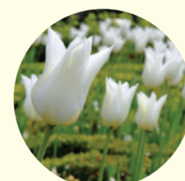
Tulipe fleur de Lis 'White Triumphato'