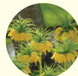
Fritillaria imperialis 'Lutea'