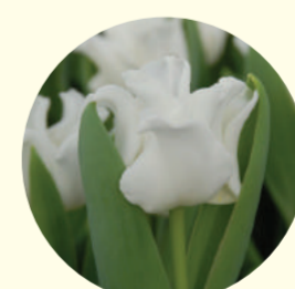
Tulipe crown 'White Liberstar'