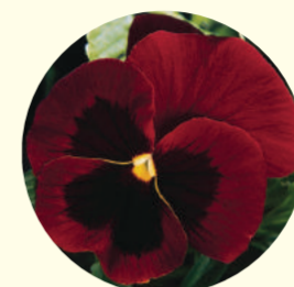
Viola wittrockiana 'Panola xp Red Blotch'

Ce sont les plans successifs qui donnent de la profondeur à ce tableau. Les jardiniers ont donc conçu un massif tout en sobriété avec des notes de couleurs soutenues. Pour cela, ils utilisent des pensées rouges, des myosotis bleus, des giroflées rouge orangé ainsi que des bulbes comme des jacinthes saumon, des narcisses bicolores et des tulipes rouges et blanches.