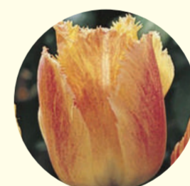
Tulipe dentelle 'Fringed Rhapsody'