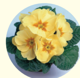
Primula acaulis 'Cairo' F1