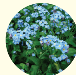
Myosotis sylvatica 'Mon Amie'