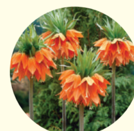
Fritillaria imperialis 'Aurora'