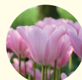
Tulipe triomphe 'Mistress'