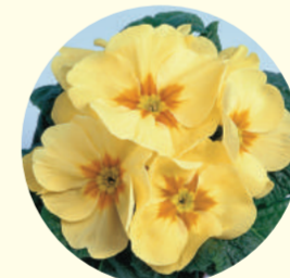
Primula acaulis 'Cairo' F1

Ce projet bénéficie du mécénat de KENZO PARFUMS