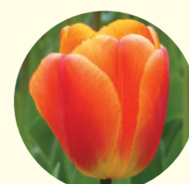
Tulipe Darwin 'Oxford Elite'