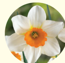
Narcissus cyclamineus 'Sempre Avanti'