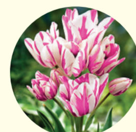
Tulipe pluriflore 'Marshmallow'