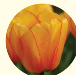
Tulipe Darwin 'Blushing Apeldoorn'