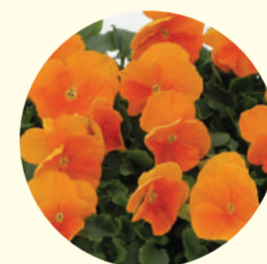
Viola wittrockiana 'Nosy Sunset'