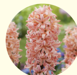
Hyacinthus orientalis 'Gipsy Queen'