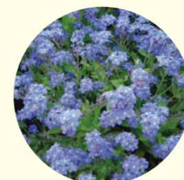
Myosotis sylvatica 'Myomark'

À partir de ce tableau doux, gai et rassurant, les jardiniers ont imaginé un massif dont les couleurs dominantes sont le bleu-gris et le blanc. Pour cela, ils utilisent des myosotis bleus, de la cinéraire grise d'où émergent des jacinthes bleues, des narcisses blancs au cœur jaune et saumon et des tulipes roses.