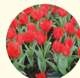
Tulipe greigii 'Princesse Charmante'