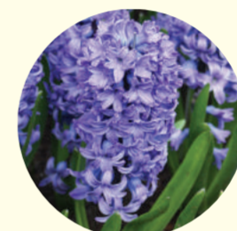
Hyacinthus orientalis 'Delft Blue'