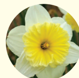
Narcissus trompette 'Ice Follies'