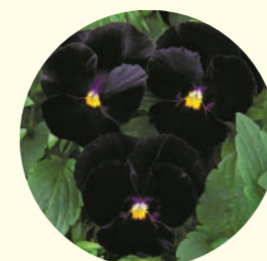
Viola wittrockiana 'Zen' F1

Les jardiniers ont été touchés par la mélancolie qui émane de ce tableau. Ils ont souhaité mettre en évidence la personnalité fragile et originale de l'artiste en rythmant leur composition avec des pensées noires, des primevères crème, des giroflées rouges et des bulbes de tulipes rouges, ocre et noires. Le chardon que tient l'artiste est évoqué par un artichaut décoratif.