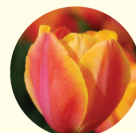
Tulipe triomphe 'Prairie Fire'