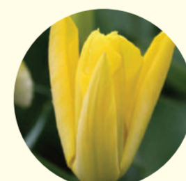
Tulipe fosteriana 'Yellow Purissima'