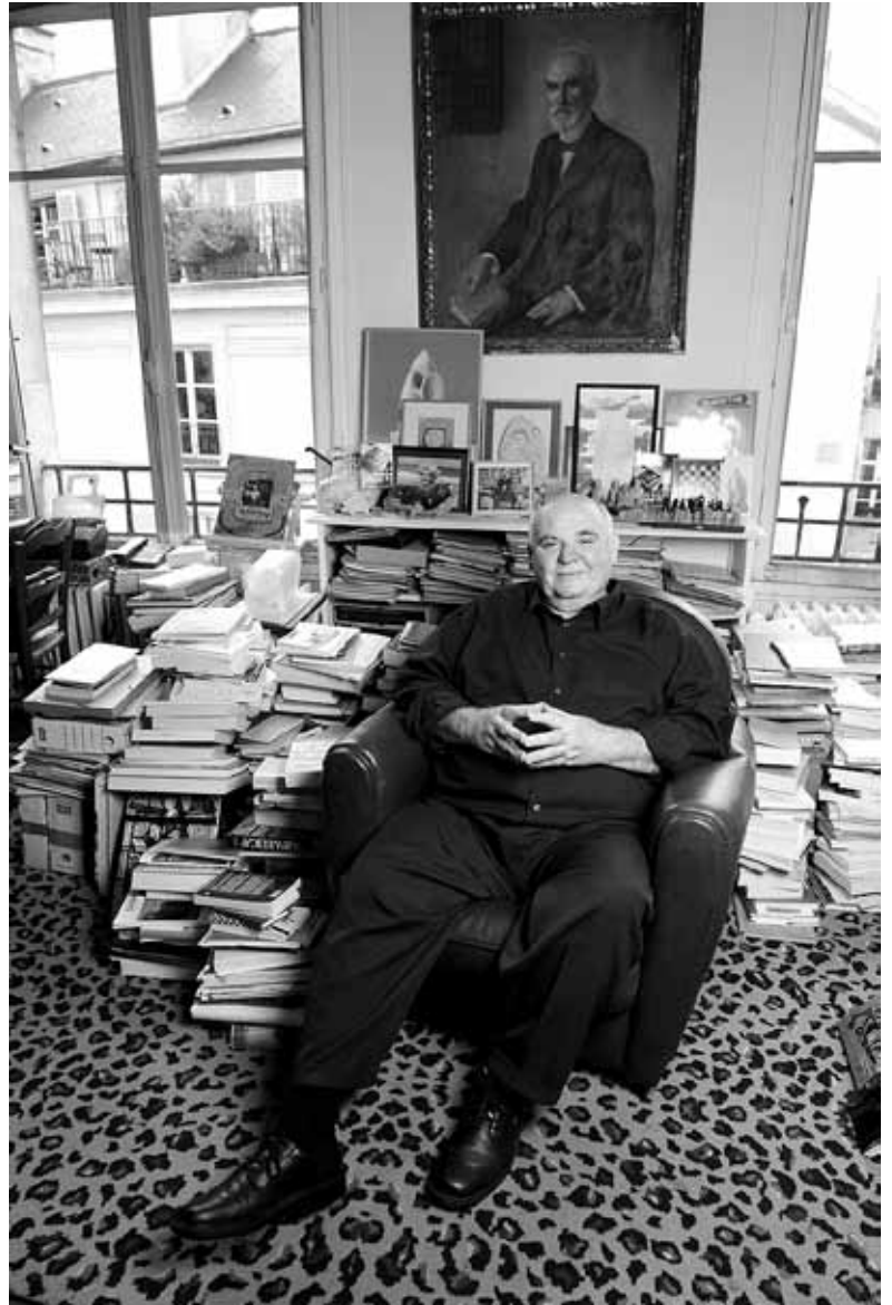
Michel Pastoureau

La « révolution bleue » des XII e et XIII e siècles