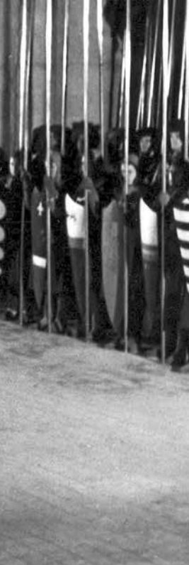
Falstaff de Orson Welles