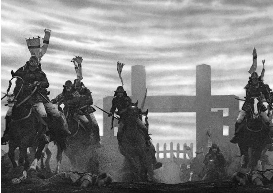
Ran de Akira Kurosawa