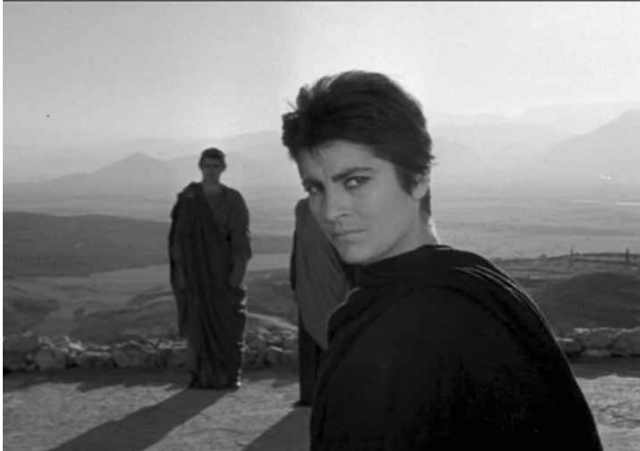
Electre de Michael Cacoyannis

la vie est revenue à la normale, mais l'art n'existe plus.