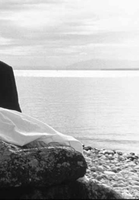
King Lear, an approach de Jean Luc Godard