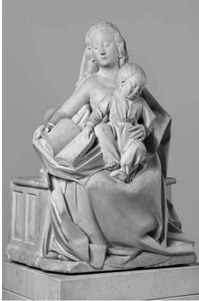
Maître de Longvè, L'Éducation de l'Enfant , fin du 15 e siècle, pierre, musée du Louvre

par Maud Leyoudec, musée Crozatier et du pays d'art et d'histoire du Puy-en-Velay et Daniele Rivoletti, université Clermont-Auvergne