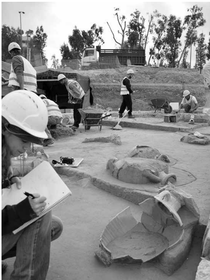
Vue du chantier de fouilles en cours

par Stella Chrysoulaki, Les Antiquités du Pirée et des îles