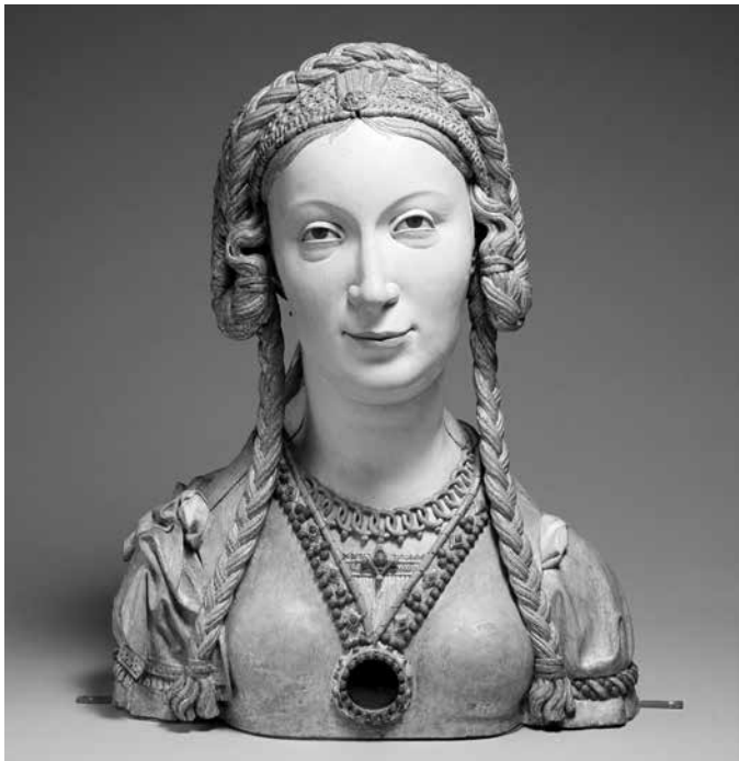
Buste Reliquaire

« Aengesien oic dat hij veele andere zware werck hadde, ende dat hij die beste meester beeldesnydere es... » : voici comment Jan II Borman est décrit à la fin d'un contrat datant de 1513, conservé aujourd'hui aux Archives générales du Royaume, à Bruxelles. On y lit qu'il est très occupé et a beaucoup de travail, et qu'il (ou parce qu'il ?) est le meilleur maître-sculpteur – ou « tailleur d'images ».