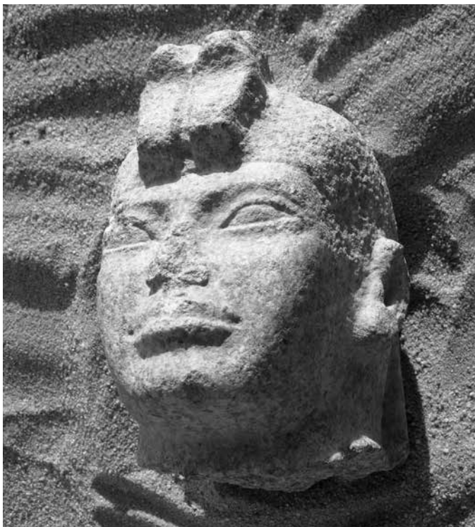
Tête d'Aspelta, souverain du Royaume de Koush (593-568 avant J.-C.)

L'excellent état de préservation du temple a suscité de nombreux défis en matière de conservation préventive. Un important programme conséquent de restauration et de présentation du site est actuellement mené.