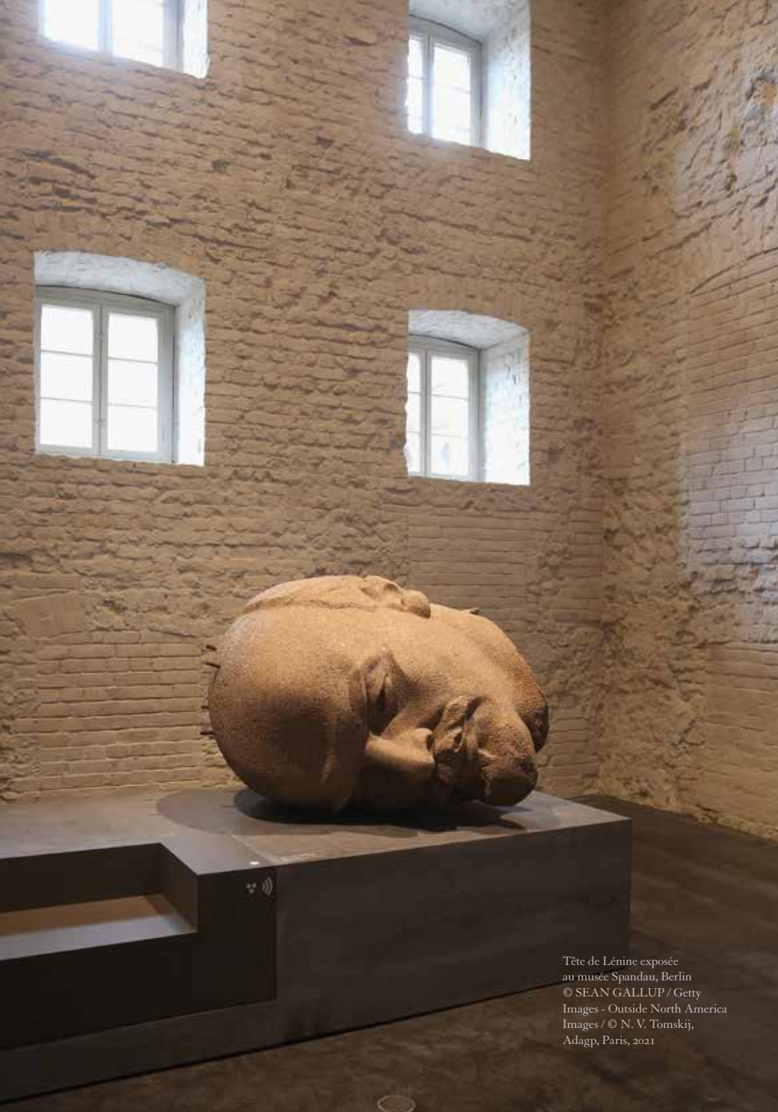
Tête de Lénine exposée au musée Spandau, Berlin