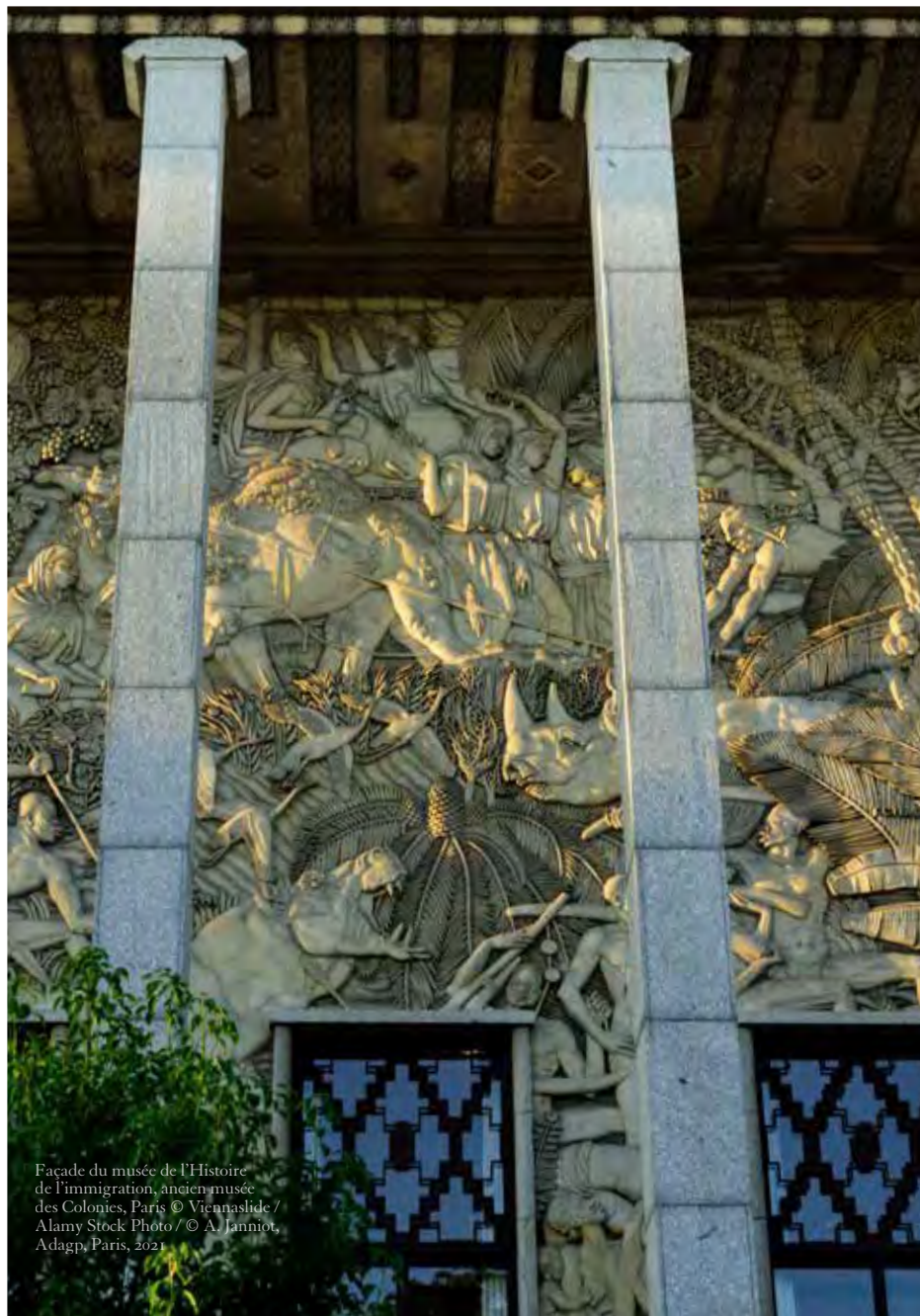
Façade du musée de l'Histoire de l'immigration, ancien musée des Colonies, Paris © A. Janniot, Adagp, Paris, 2021