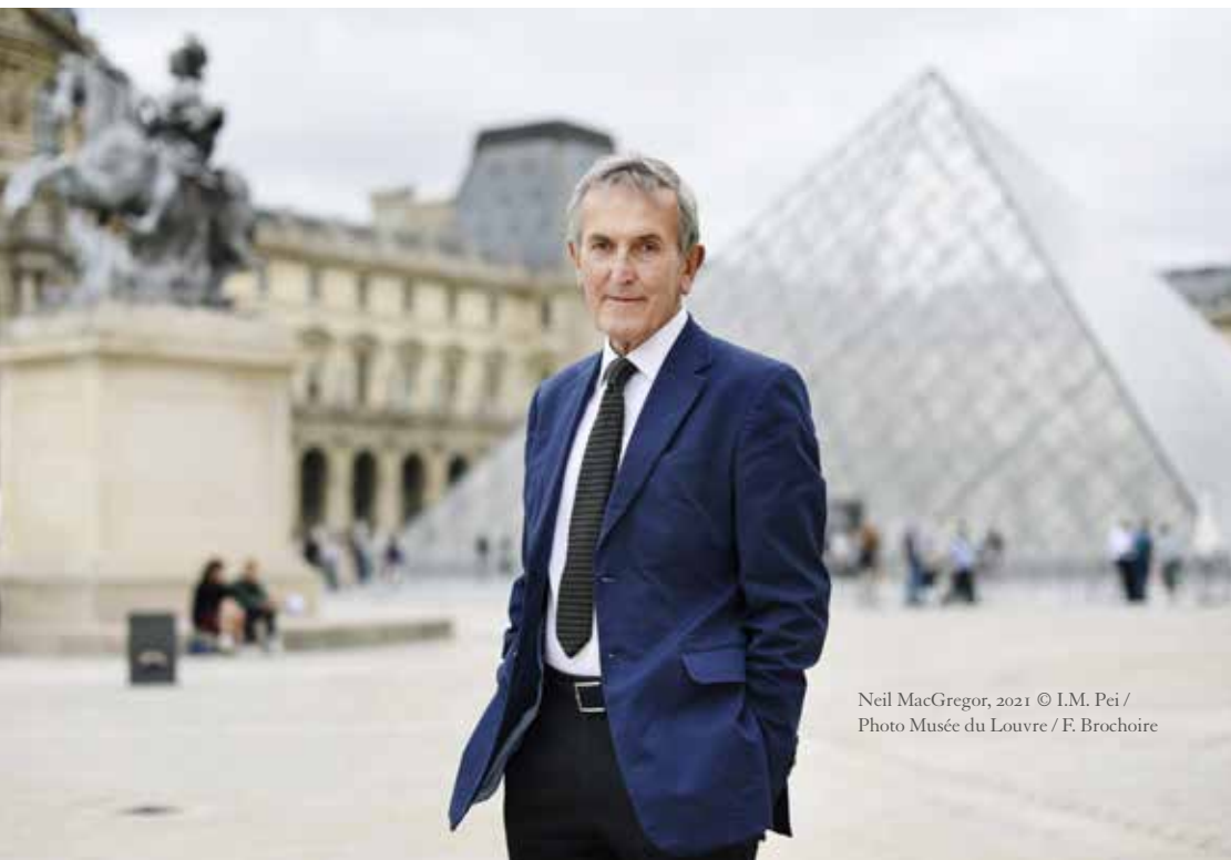
Neil MacGregor, 2021

humaine. Il y démontre le pouvoir qu'ont les choses de relier les hommes, alors qu'ils sont très éloignés dans l'espace et le temps. Passionné depuis toujours par la façon dont les musées racontent l'histoire du monde, Neil MacGregor participe de 2015 à 2018 à la création du Humboldt Forum à Berlin, comme directeur-fondateur. Il est actuellement conseiller international du J. Paul Getty Trust, aux États-Unis, et du musée CSMVS de Mumbai, en Inde. Neil MacGregor donne de nombreuses conférences dans le monde entier et continue ses émissions sur l'histoire culturelle à la BBC.