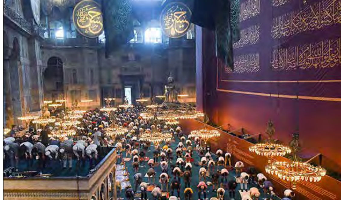
Sainte-Sophie, l'ex-musée de Sainte-Sophie, redevenue mosquée en juillet 2020, Istanbul