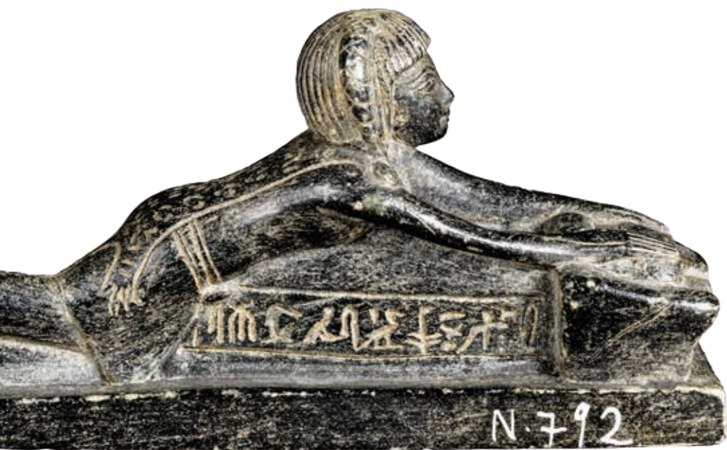
Prêtre « bouclé » représenté en meunier

« Anastylose » est un terme qui, en archéologie, désigne une technique permettant de reconstituer un monument ruiné en utilisant les fragments qui lui appartiennent et trouvés habituellement sur le site même où ce monument a été érigé. Les mythes égyptiens ne nous étant guère parvenus sous forme de récits continus, il est tentant d'utiliser une technique similaire pour les reconstituer : ces fragments, que l'on nomme mythèmes, sont glanés dans les textes de tous genres et toutes les époques. Deux exemples d'anastylose mettent la méthode en pratique.