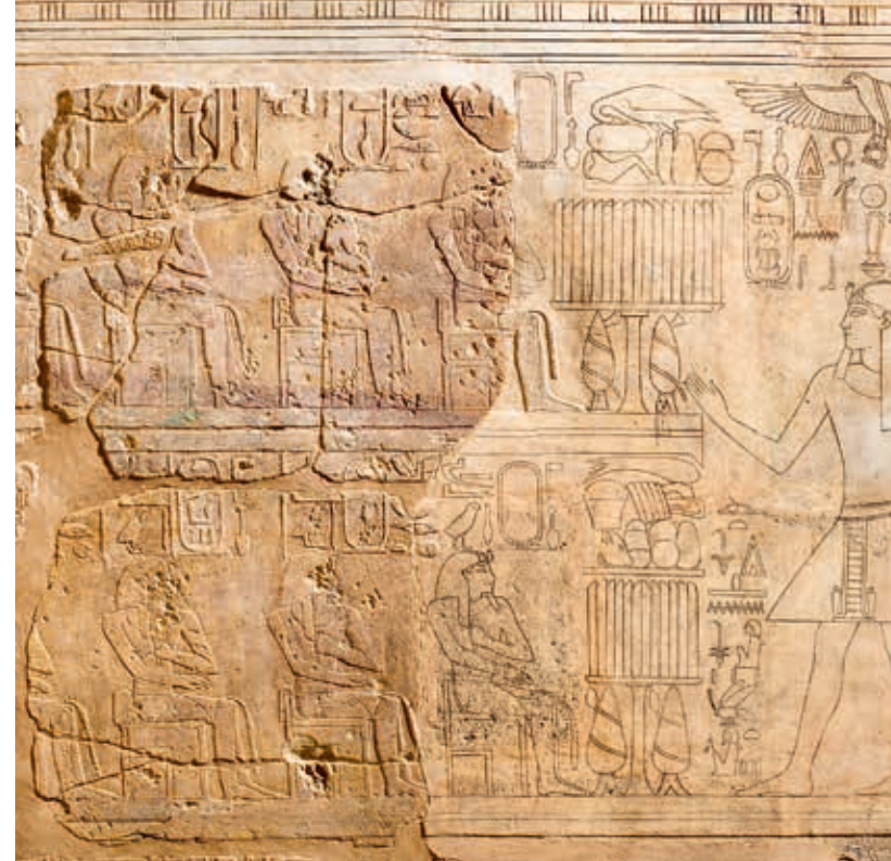
Chambre des ancêtres