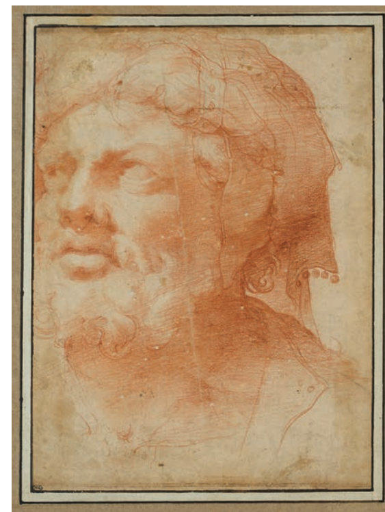
Attribué à Pellegrino Tibaldi, Tête d'homme coiffé d'un turban, de trois quarts, regardant vers le haut

Le musée du Louvre conserve environ cinq cents dessins de l'école bolonnaise du XVI e siècle. À l'occasion de la parution de l'Inventaire général des dessins italiens consacré à l'école bolonnaise, cette sélection d'une centaine de feuilles illustrera l'évolution du style de ces dessins à Bologne, du début du Cinquecento aux années 1580. L'occasion de redécouvrir des œuvres d'une grande qualité et de saisir des personnalités artistiques qui, dès le XVI e siècle, n'ont pas échappé aux grands collectionneurs de dessins comme Giorgio Vasari ou Everard Jabach.