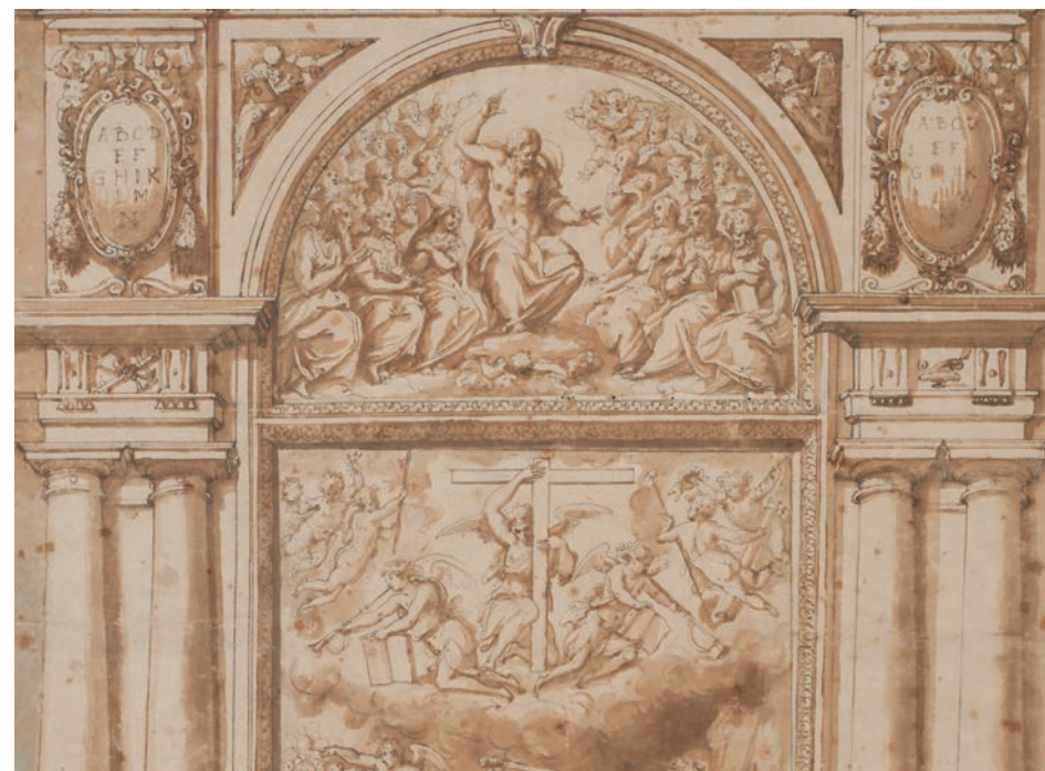
Giorgio Vasari, étude pour un retable avec le Jugement dernier (détail)