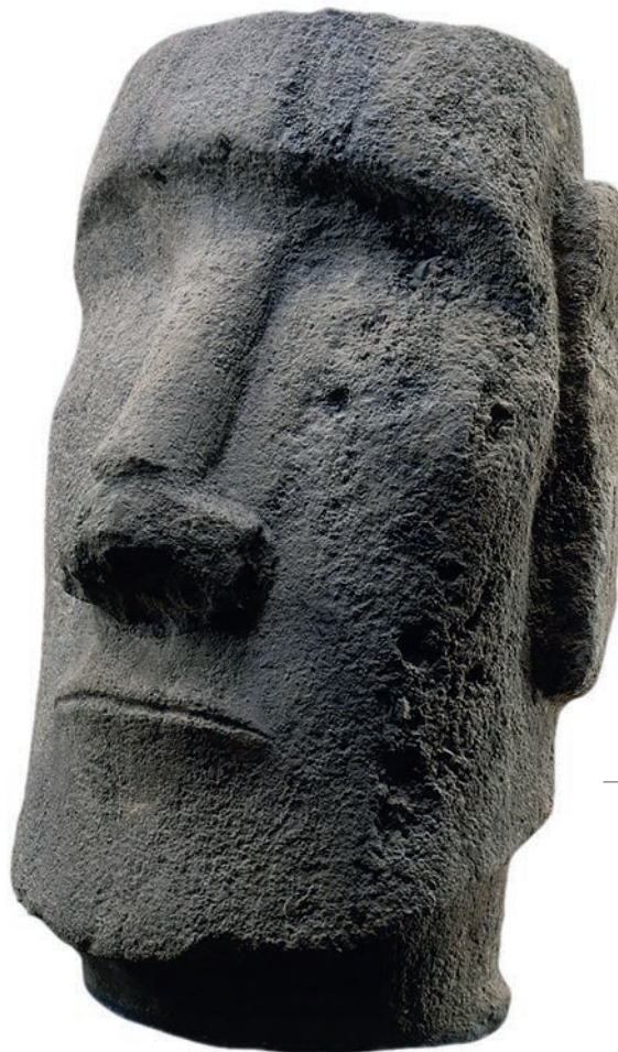
Tête monumentale (moai) de l'île de Pâques, pavillon des Sessions

Depuis l'Antiquité, les plus grands artistes ont représenté les choses inanimées en leur redonnant vie. L'exposition présentera 200 chefs-d'œuvre, démontrant à quel point le dialogue avec les objets a changé au cours du temps. Des mosaïques de fruits et de gibiers antiques aux ballons de Koons, en passant par Caravage, Chardin, Picasso, Warhol et Tati, toute l'histoire de l'art sera revisitée. C'est aussi notre relation avec les biens matériels qui sera racontée dans un scénario original et vivant, qui éclaire l'histoire de la culture occidentale.