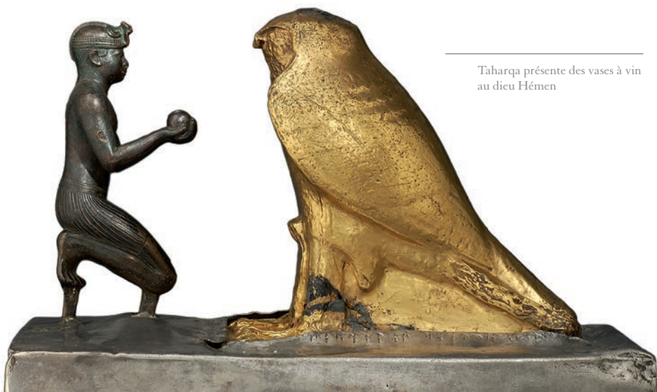
Taharqa présente des vases à vin au dieu Hémen

Au VIII e siècle avant Jésus-Christ, en Nubie, un royaume s'organise autour de sa capitale Napata. Vers 730 avant Jésus-Christ, le souverain Piankhi entreprend de conquérir l'Égypte et inaugure la dynastie des pharaons kouchites. Ses successeurs régneront durant plus de cinquante ans sur un royaume s'étendant de la Méditerranée jusqu'au confluent du Nil Blanc et du Nil Bleu. Le plus célèbre d'entre eux est sans conteste Taharqa. L'exposition met en lumière le rôle de premier plan de ce vaste royaume, situé dans ce qui est aujourd'hui le centre du Soudan.