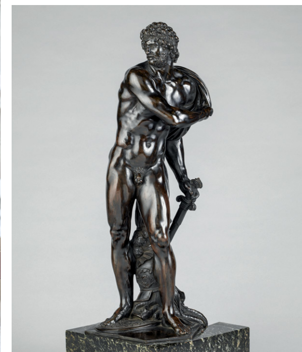
Mars quittant les armes, par Michel Anguier don des Amis du Louvre en 2017