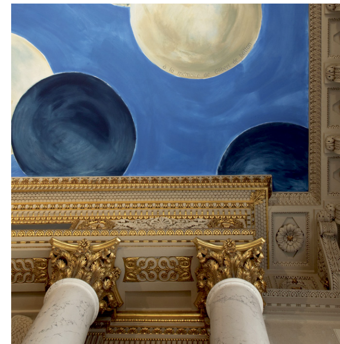
Ancienne salle des collections Campana au Louvre sous Napoléon III, actuellement en restauration