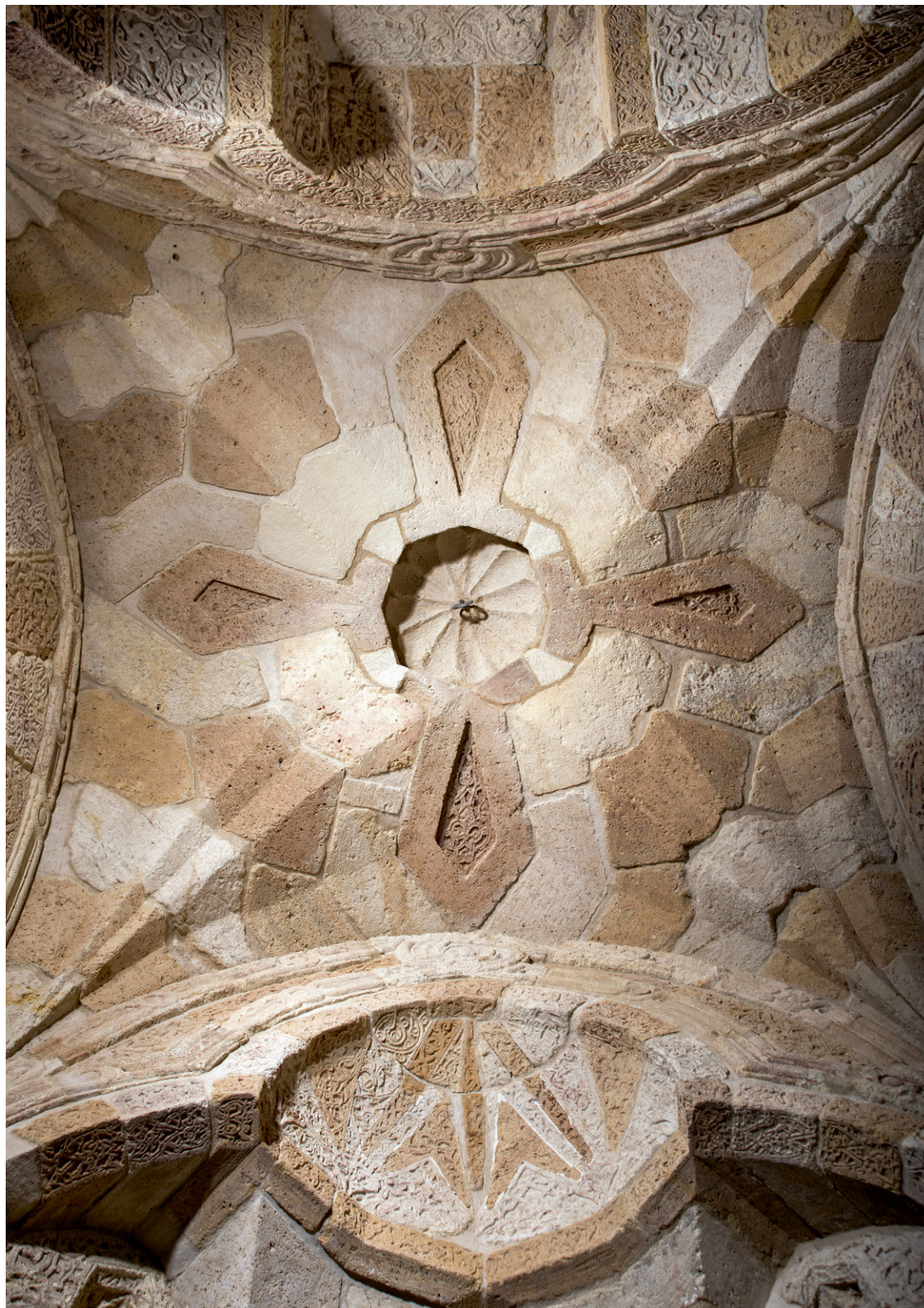
Porche d'une demeure mamelouke au Caire, musée du Louvre, Paris

Directrice du département des Arts de l'Islam du musée du Louvre