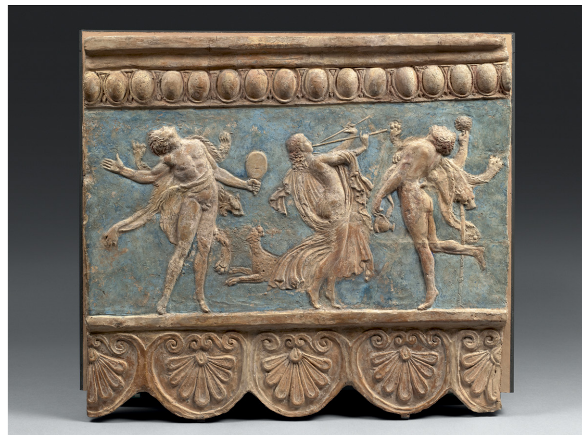
Plaque Campana, 1 er siècle av. J-C., musée du Louvre