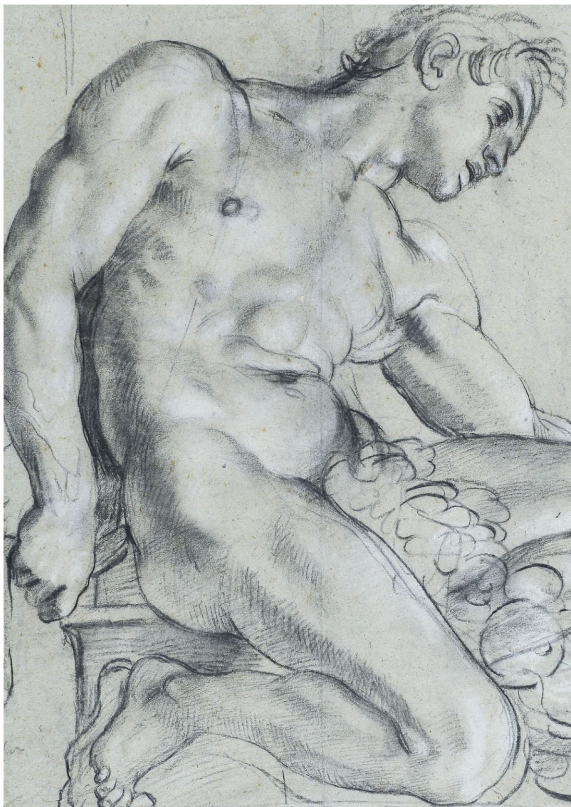
Étude pour la fresque de la galerie du Palais Farnèse, Annibale Carracci, musée du Louvre

Directeur du département des Arts graphiques du musée du Louvre