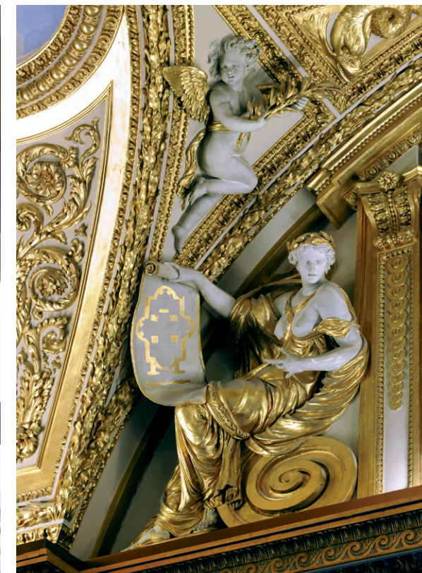
La Magnificence, par Michel Anguier décoration pour les appartements d'Anne d'Autriche