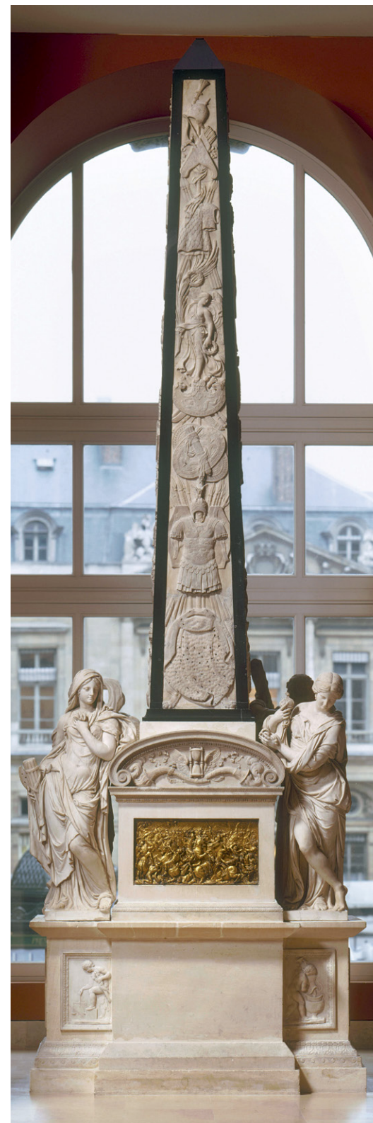
Monument funéraire du cœur du duc Henri I er de Longueville, par François Anguier