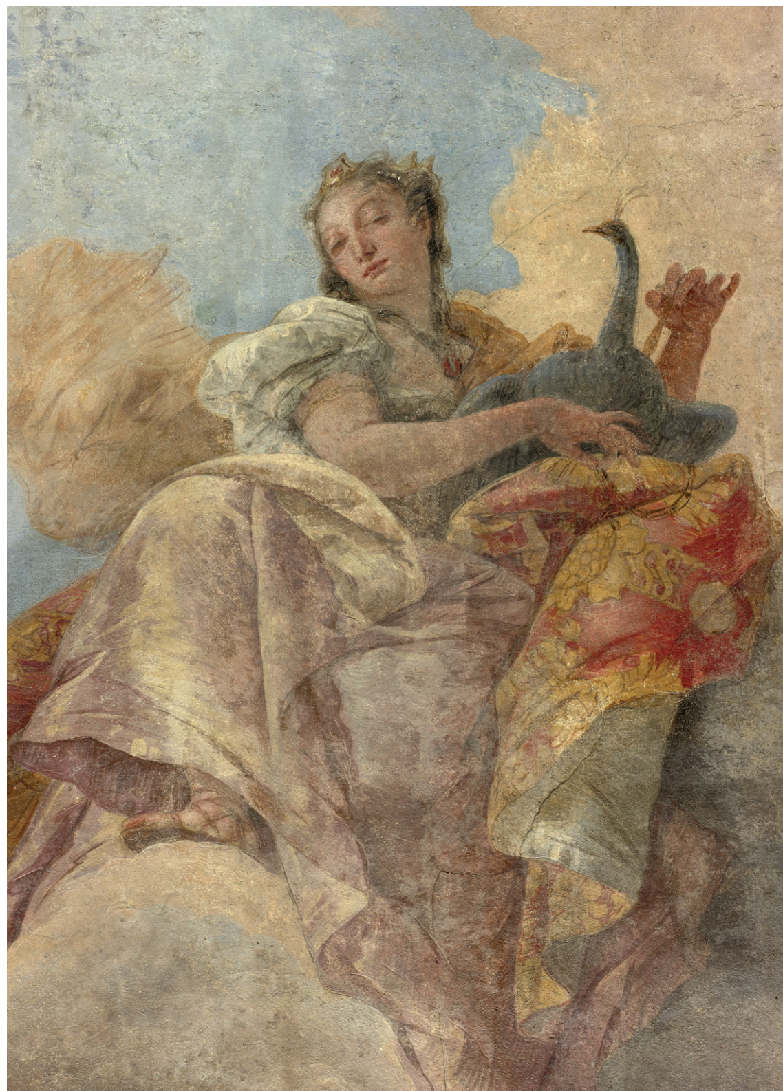
Junon au milieu des nuées , vers 1735, Giovanni Battista Tiepolo (1696 - 1770), musée du Louvre, acquisition grâce à la participation des Amis du Louvre