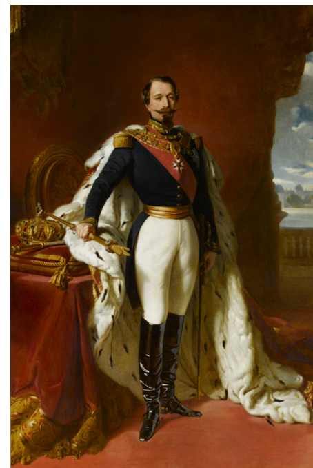
Napoléon III, par Franz-Xaver Winterhalter

Conservateur en chef au département des Antiquités grecques, étrusques et romaines du musée du Louvre