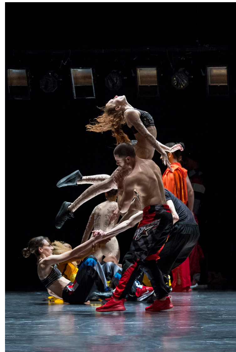
CCN-Ballet de Lorraine, Static Shot , chorégraphie Maud Le Pladec