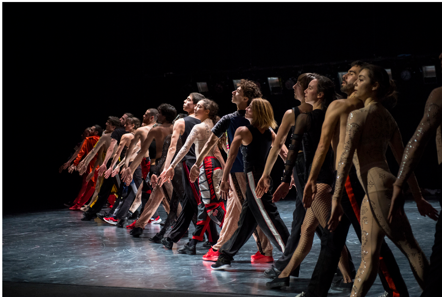
CCN-Ballet de Lorraine, Static Shot , chorégraphie Maud Le Pladec

Le CCN - Ballet de Lorraine est soutenu par le Ministère de la Culture – DRAC Grand-Est, Le Conseil Régional Grand-Est et la Ville de Nancy