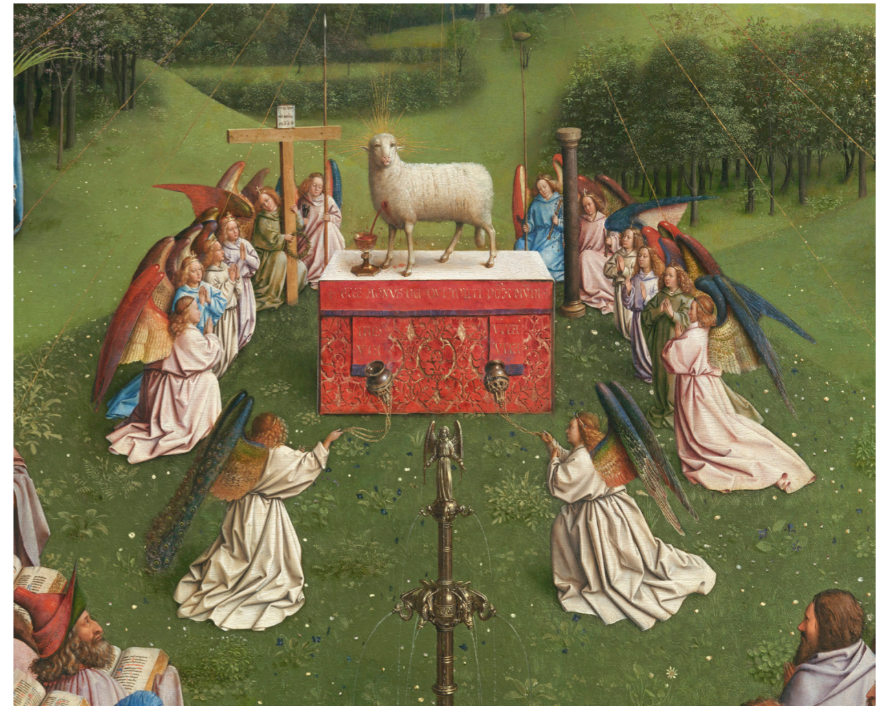
Hubert et Jan van Eyck, Retable de l'Agneau mystique , Gand, Cathédrale Saint-Bavon, détail (après restauration, 2020)

La campagne de conservation et de restauration réalisée par l'Institut royal du patrimoine artistique (IRPA) a été initiée en 2012. Le travail interdisciplinaire mené par l'IRPA, aidé par les universités de Gand et d'Anvers, associe l'expérience pratique et la recherche scientifique de pointe. Les surpeints, découverts et étudiés par les conservateurs-restaurateurs en collaboration avec l'équipe du laboratoire, ont été enlevés ou sont en cours d'enlèvement. Ce traitement validé par une commission internationale d'experts révèle la qualité extraordinaire de l'œuvre. Elle conduit aussi à reconsidérer des questionnements fondamentaux sur la genèse et l'interprétation du retable.