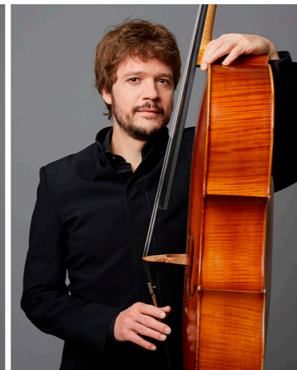
Frédéric Peyrat © Studio Cabrelli / OdP