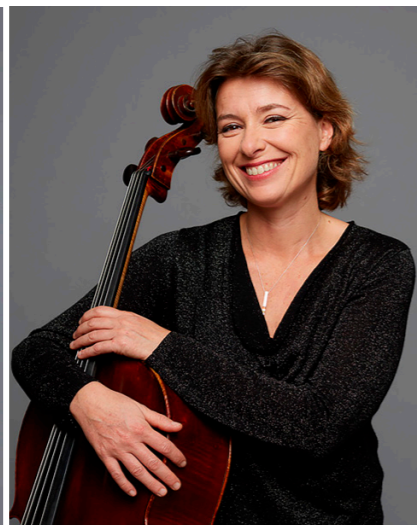
Claude Giron © Studio Cabrelli / OdP