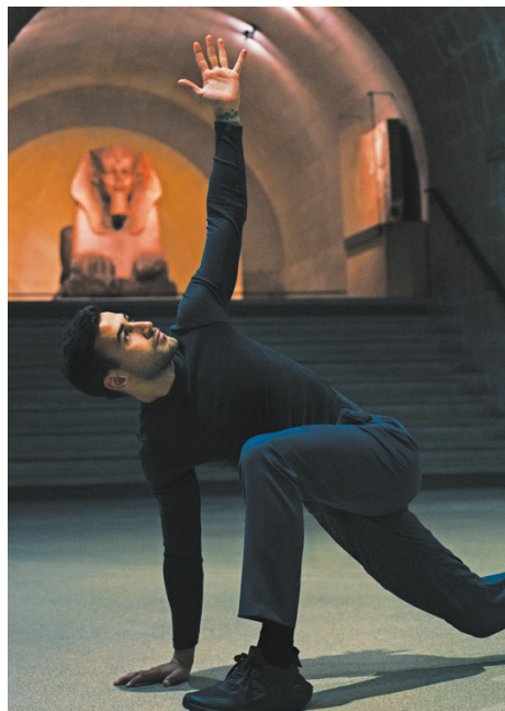
Léo Bordessoule © 2023, Musée du Louvre/Hanna Pallot