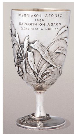
Coupe Bréal en argent, conçue par Michel Bréal Décernée en 1896 à Spyridon Louis, vainqueur du marathon des premiers JO d'Athènes © Fondation Stavros Niarchos (SNF).

Pour cette troisième tenue des Jeux Olympiques et Paralympiques à Paris en 2024, le musée du Louvre propose au public de découvrir la création des premiers JO et leurs sources iconographiques à la fin du 19 e siècle, pour mieux saisir le contexte politique et pour comprendre comment ses organisateurs ont réinventé les concours de la Grèce antique.