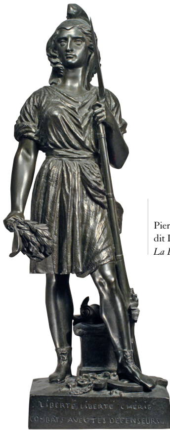
Pierre-Jean David, dit David d'Angers, La Liberté