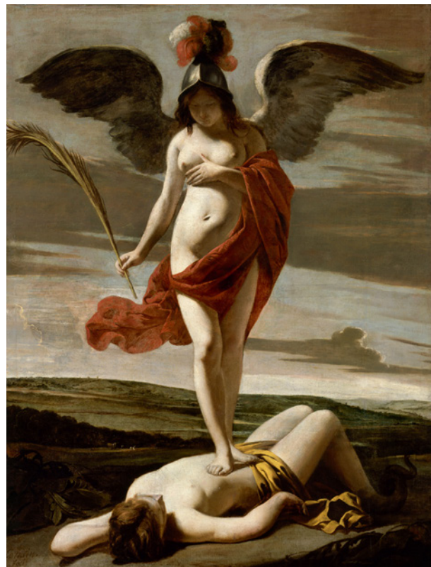
Mathieu Le Nain, Allégorie de la Victoire