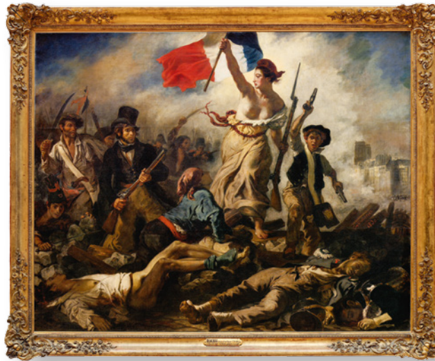
Eugène DELACROIX (Charenton-Saint-Maurice, 1798 – Paris, 1863) La Liberté guidant le peuple (28 juillet 1830). Salon de 1831 Huile sur toile H. : 2,60 m ; L. : 3,25 m Acquis au Salon de 1831 Transféré du musée du Luxembourg au Louvre, 1874 Département des Peintures

« Bon et cher frère, ta bonne lettre m'avait fait un bien grand plaisir. Pour le "spleen", il s'en va grâce au travail. J'ai entrepris un sujet moderne, une barricade, et si je n'ai pas vaincu pour la patrie, au moins peindrais-je (sic) pour elle. Cela m'a remis de belle humeur. »