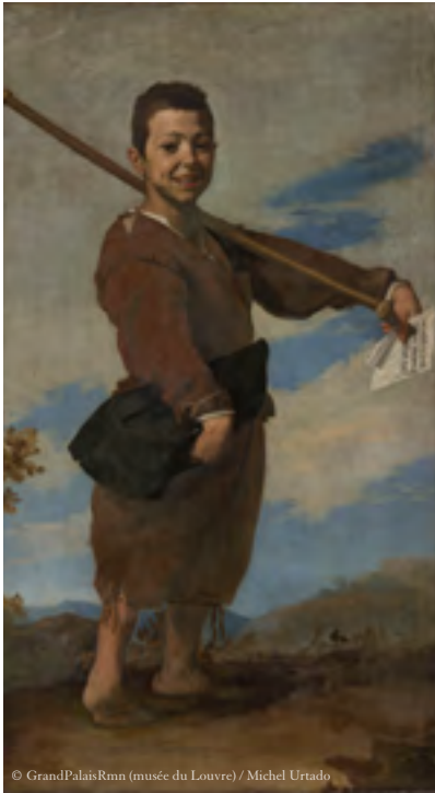
Jusepe de Ribera (1591-1652) Le pied-bot (1642) Huile sur toile, MI 2893