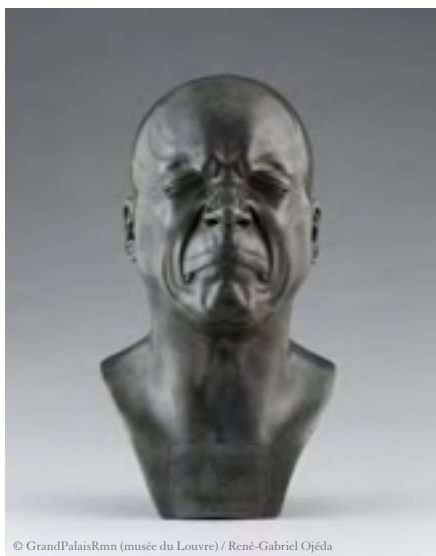
François-Xavier Messerschmidt (1736-1783) Bronze, Paris, musée du Louvre, RF 4724