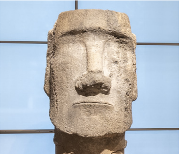
Tête de sculpture moaï, Sculpteur Rapa Nui, Roche volcanique, entre le 11 e et le 15 e siècle, Galerie des cinq continents, musée du Louvre / Musée du quai Branly – Jacques Chirac

Qu'est-ce que ces sculptures ont à nous raconter ? Que font-elles sur cette île au milieu de l'océan pacifique ? Qui les a confectionnées et comment ont-elles été déplacées ?