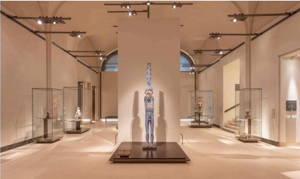
Vues de la Galerie des cinq continents, musée du Louvre