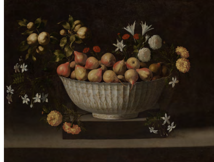
Francisco de Zurbarán, Fleurs et fruits dans un bol de porcelaine

Jeudi 26 novembre 2026 À partir de 19h 15