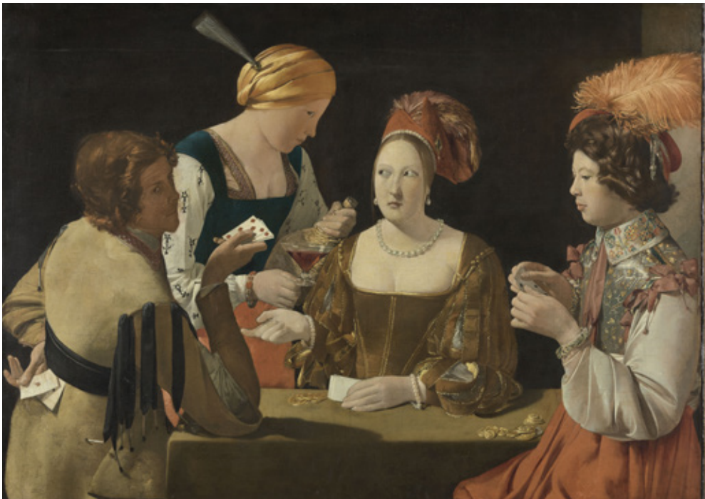
Georges de La Tour, Le Tricheur à l'as de carreau , musée du Louvre © RMN - Grand Palais (Musée du Louvre) / Adrien Didierjean

Entrez dans la vie et l'univers mystérieux de Georges de La Tour avec l'un de ses plus célèbres tableaux Le Tricheur à l'as de carreau . Entre ombre et lumière, coups de bluff et secrets, méfiez-vous des apparences, ce chef-d'œuvre révèle, des regards complices et des ruses savamment orchestrées. Qui triche, qui est dupé ? Une plongée fascinante dans l'art du clair-obscur et les jeux d'illusions de La Tour.