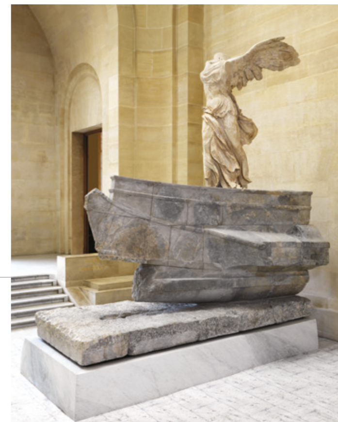
La Victoire de Samothrace , île de Samothrace, vers 200/175 av. J.-C., Marbre gris de Lartos et marbre de Paros, musée du Louvre

Partez à la découverte de l'œuvre dans les collections du musée ! Accès libre au musée, avec votre billet du spectacle, le jour de la représentation.